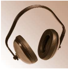
WAVE - Gehörschützer, Tector, EN 352-1, mit