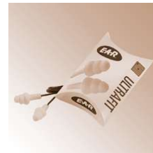
ULTRAFIT - Gehörschutzstöpsel, EN 352-2, mit Kordel,