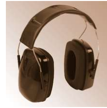
LA 3003 SHOT - Gehörschützer, Las, EN 352-1, mit