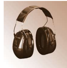
OPTIME II - Peltor-Kopfbügel-Gehörschützer, EN 352-1,