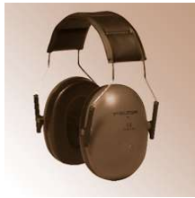
H4A - Peltor-Kopfbügel-Gehörschützer, EN 352-1, blau