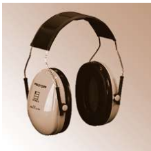
OPTIME I - Peltor-Kopfbügel-Gehörschützer, EN 352-1,