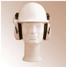
LA 3015 SHOT - Helm-Bügel-Gehörschutz, EN 352-2, Las,