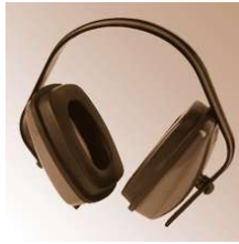
EURO - Gehörschützer, Tector, EN 352-1, mit