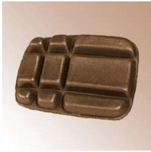
Knieschoner, 20 x 15 cm