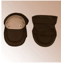
Knieschoner XXL, 29 x 16 cm