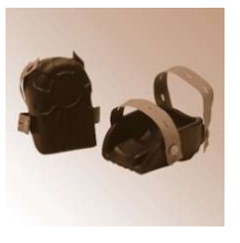
ERGONOMIC - Knieschoner