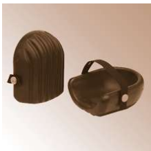
SOLIDA - Knieschoner, harte Schale