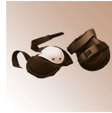
COMFORT - Knieschoner, weiche Schale