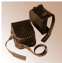
RUND - Knieschoner, schwarz, schalenform

"- 1 Textilriemen Material: Polyurethan, FCKW-frei geschäumt" "- 1 Textilriemen Material: Polyurethan, FCKW-frei geschäumt"