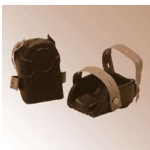
ECKIG - Knieschoner, schwarz, Kastenform

"- 2 Textilriemen Material: Polyurethan, FCKW-frei geschäumt" "- 2 Textilriemen Material: Polyurethan, FCKW-frei geschäumt"