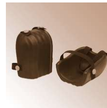
Knieschoner aus Gummi, Profi Ausrüstung

"- mit Schaumgummi-Polsterung - 2 Befestigungsriemen Material: Gummi" "- mit Schaumgummi-Polsterung - 2 Befestigungsriemen Material: Gummi"