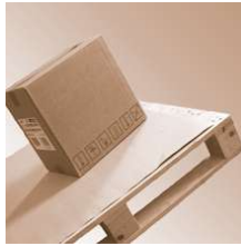
SafetyGripBoard 0,4mm 1000x1000 mm

SafetyGripBoard 0,4mm Abmessung 1000 x 1000 mm Safetygrip, Antirutsch Produkte SafetyGripBoard 0,4mm