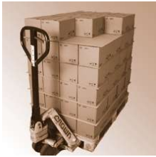
SafetyGrip paper Stripe 0,2 mm 1140x1140 mm

SafetyGrip paper Stripe 0,2 mm Abmessung 1140 x 1140 mm Safetygrip, Antirutsch Produkte Anwendung Antirutschprodukte bei YouTube ansehen! SafetyGrip paper Stripe 0,2 mm