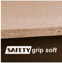
SafetyGrip Board 0,4 mm 800x1200mm

SafetyGrip Board 0,4 mm Abmessung 800 x 1200 mm Safetygrip, Antirutsch Produkte SafetyGrip Board 0,4 mm