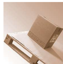
SafetyGrip Board 0,4 mm 1200x1250mm

SafetyGrip Board 0,4 mm Abmessung 1200 x 1250 mm Safetygrip, Antirutsch Produkte SafetyGrip Board 0,4 mm