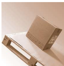
SafetyGrip Soft 2,2 mm 150x800mm

SafetyGrip Soft 2,2 mm Abmessung 150 x 800 mm Safetygrip, Antirutsch Produkte SafetyGrip Soft 2,2 mm