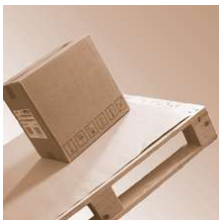
SafetyGrip board 0,8 mm 800x1200 mm

SafetyGrip board 0,8 mm Abmessung 800 x 1200 mm Safetygrip, Antirutsch Produkte SafetyGrip board 0,8 mm