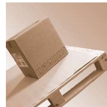
SafetyGrip board 0,4 mm 1150x1150 mm

SafetyGrip board 0,4 mm Abmessung 1150 x 1150 mm Safetygrip, Antirutsch Produkte SafetyGrip board 0,4 mm