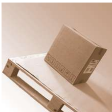
SafetyGrip Soft 2,2 mm 150x1000mm

SafetyGrip Soft 2,2 mm Abmessung 150 x 1000 mm Safetygrip, Antirutsch Produkte SafetyGrip Soft 2,2 mm