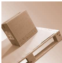
SafetyGrip board 0,8mm 1000x1200 mm

SafetyGrip board 0,8mm Abmessung 1000 x 1200 mm Safetygrip, Antirutsch Produkte SafetyGrip board 0,8mm