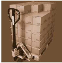
SafetyGrip paper Stripe 0,2 mm 740x1140 mm

SafetyGrip paper Stripe 0,2 mm Abmessung 740 x 1140 mm Safetygrip, Antirutsch Produkte Anwendung Antirutschprodukte bei YouTube ansehen! SafetyGrip paper Stripe 0,2 mm