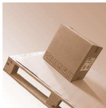
SafetyGrip Soft 2,2 mm 150x1200mm

SafetyGrip Soft 2,2 mm Abmessung 150 x 1200 mm Safetygrip, Antirutsch Produkte SafetyGrip Soft 2,2 mm