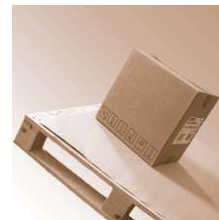
SafetyGrip Soft 2,2 mm 150x200mm

SafetyGrip Soft 2,2 mm Abmessung 150 x 200 mm Safetygrip, Antirutsch Produkte SafetyGrip Soft 2,2 mm