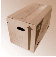
BOX 650 x 350 x 370 mm Umzugskarton

BOX 2.4 650 x 350 x 370 mm Umzugskarton 2.4 Aussenabmessung 650 x 350 x 370 mm BOX 2.4 650 x 350 x 370 mm Umzugskarton 2.4 Aussenabmessung 650 x 350 x 370 mm