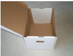
WP-Archivbox komplett weiß

IM 400 x 300 x 287mm AM 430 x 335 x 305mm 36,74l ca. 780gr pro Stück glatter Boden angehängter Deckel 200 Stück = 1 Palette IM 400 x 300 x 287mm