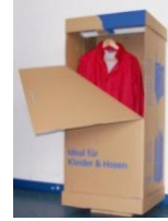
Kleiderkiste mit Stange

2wellige Qualiät 600 x 515 x 1350mm Palette 25 Stück 2wellige Qualiät600 x 515 x 1350mmPalette 25 Stück