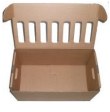
WP-Archivboxen für 7 Ordner

575 x 325 x 305mm 7 Rückstanzungen 575 x 325 x 305mm7 Rückstanzungen