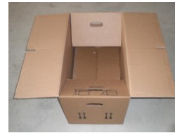
Umzugskarton Premium Qualität